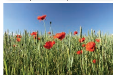
GROTE KLAPROOS ( PAPAVER RHOEAS )