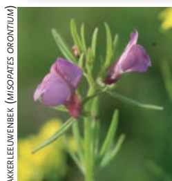
AKKERLEULWENBEK ( MISOPATES ORONTIUM )