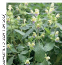
DALVINETEL ( GALEOPSIS SPECIOSA )

Op zaterdag 3 september 2022 organiseert de Plantenstudiegroep van het Natuurhistorisch Genootschap in samenwerking met de Plantenwerkgroep van Likona de 11 e Euregionale botanische bijeenkomst. Doel van deze bijeenkomsten is om de contacten tussen botanici aan weerszijden van de grens aan te halen. Tijdens de bijeenkomsten maken we kennis met elkaars natuurgebieden betreffende de flora, het beheer, de werkwijze, activiteiten, projecten en onderzoeken.