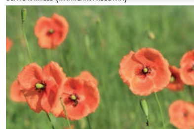
BLEKE KLAPROOS ( PAPAVER DUBIUM )