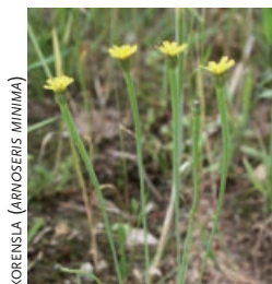
KORENSLA ( ARNOSEERIS MINIMA )