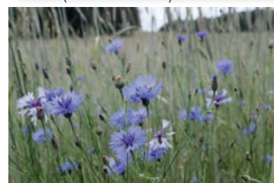
KORENBLOEM ( CENTAUREA CYANUS )