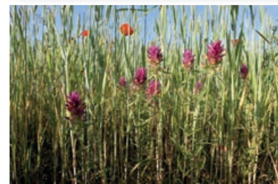
WILDE WEIT ( MELAMPYRUM ARVENSE )